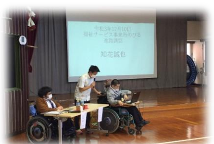
卒業生による進路講話