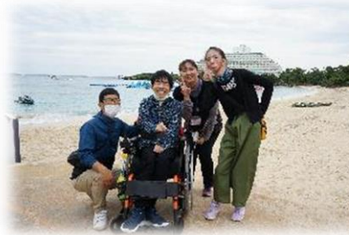
県内修学旅行（高等部）