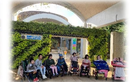
秋の遠足（中学部・高等部） （熱帯ドリームセンター）