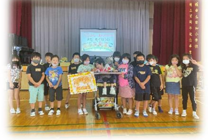
居住地校交流（小学部）