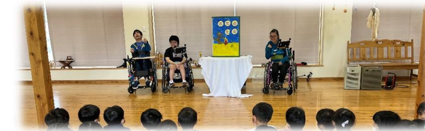
隣の保育園で行う絵本の読み聞かせ活動