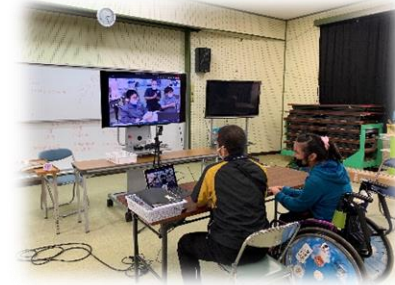
他校とのオンライン共同学習