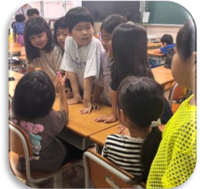
居住地校交流（小学部）