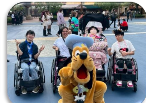
県外修学旅行（高等部）