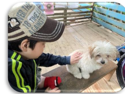
校外学習（小学部ネオパーク）