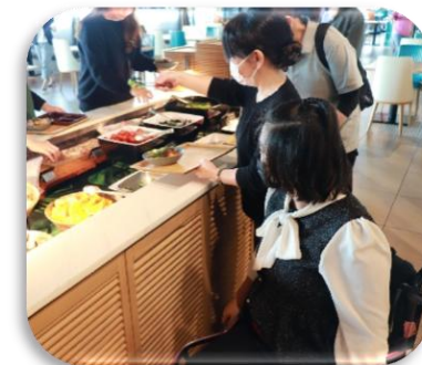
高等部マナー学習